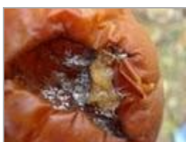
Pomme pourrie avec coussinets verts de Penicillium expansum

La patuline est relativement stable quelle que soit la température, notamment en cas de pH acide. Les traitements thermiques ne suffisent pas à éliminer la patuline. En revanche, les boissons fermentées (sans adjonction de jus) n'en contiennent pas.