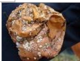
Moniliose sur pomme

Si les spores des moisissures capables de produire de la patuline sont présentes partout, dans les vergers, les stations fruitières et les ateliers de transformation, elles ne se développent en général que sur des blessures de type piqûres d'insectes, chocs subis par les fruits, altération de l'épiderme suite à une attaque d'autres champignons. Pourtant, tous les fruits contaminés ne sont pas visibles de l'extérieur car la maladie peut se développer également à l'intérieur du fruit au cœur du fruit ou lors de l'altération des pépins.